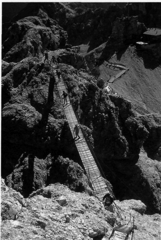
Il ponte sospeso del «Sentiero Ferrato Dibona» (itinerario 15)