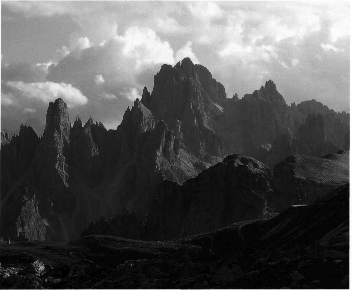
Dietro il vecchio settore del fronte delle Tre Cime si stagliano le bizzarre guglie dei Cadini (itinerario 9).