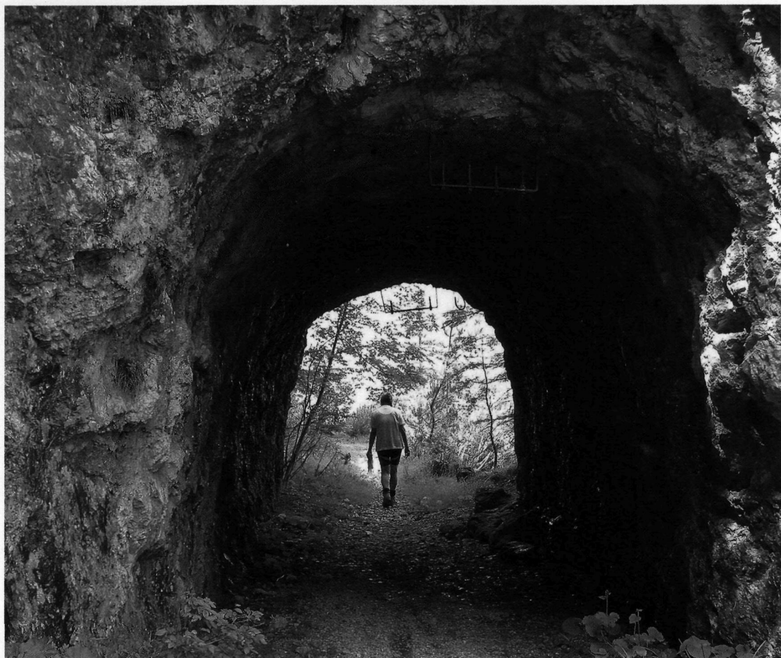
Tunnel lungo la vecchia strada per il Comando Austriaco (itinerario 24)